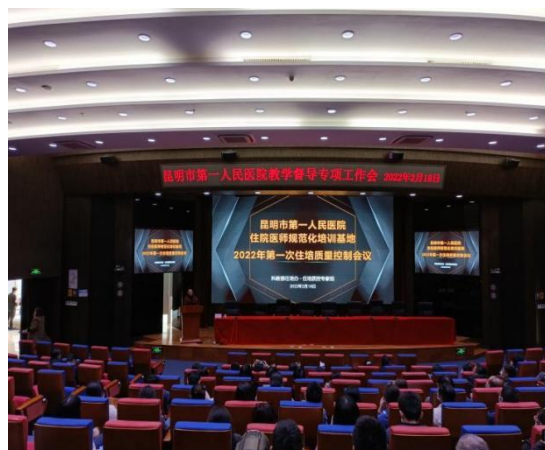
(院级住培质控会议)