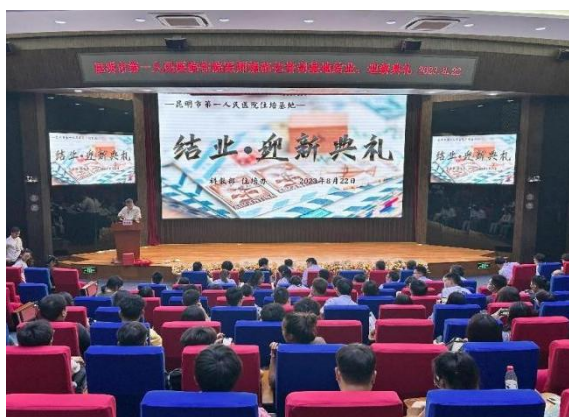
(结业·迎新典礼现场)

过率均在 80%左右，自 2021 年起“结业首考”均在 95%以上，2024 年达 98.23%，“两率”中临床实践技能考核部分通过率均为 100%。2022 年在全国全科专业教学查房比赛中，我基地在全省 14 家参赛单位中排名第三；2024 年全科专业指导医师教学综合技能大赛全省第二；连续四年承担住培结业考实践技能考核考点工作。在注重培训质量的同时，对于学员的人文教育也是我基地重点关注的内容，定期评优评先、丰富的业余文化生活、教师节活动、学员干部队伍的建设、结业·迎新典礼等都在不同程度上给予在培学员人文关怀，进一步增加学员“归属感”和“认同感”。