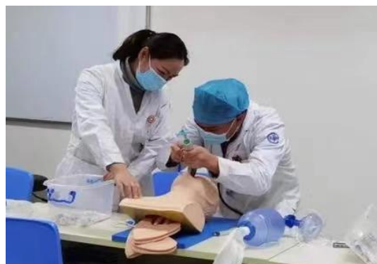
(轮转科室一对一培训)