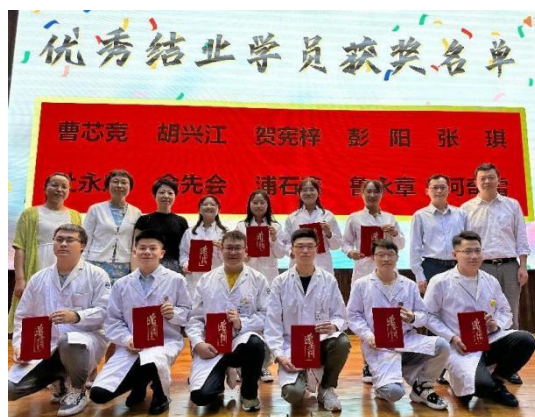
(优秀结业学员表彰)