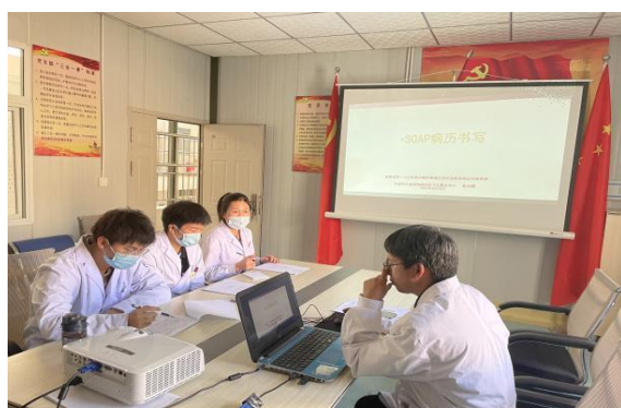
(全科基层基地日常培训)