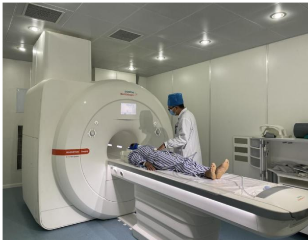
1.5T 西门子 MIR (磁共振)