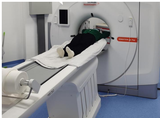
64 排西门子 CT