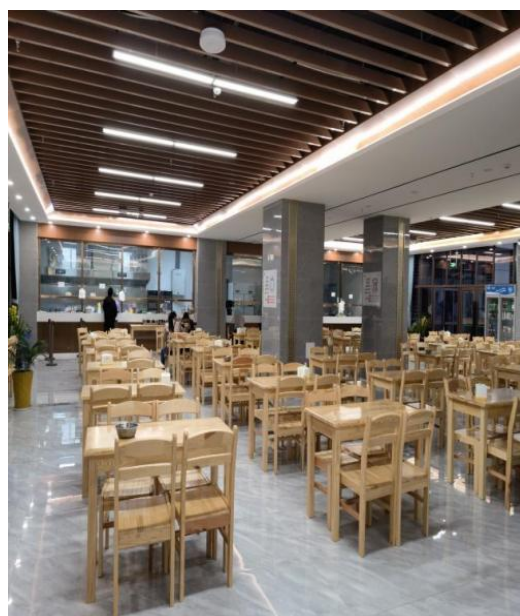
便民食堂和后勤行政楼