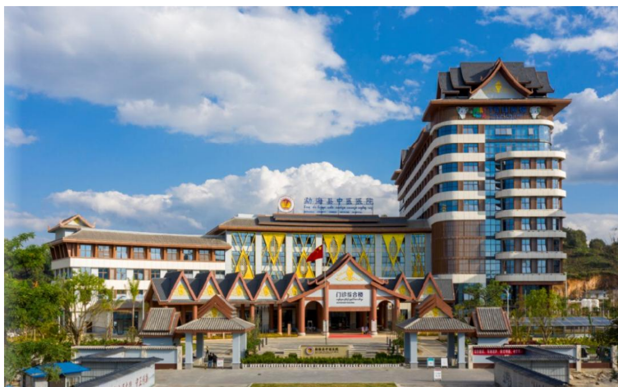
门诊综合楼和 1 号住院楼