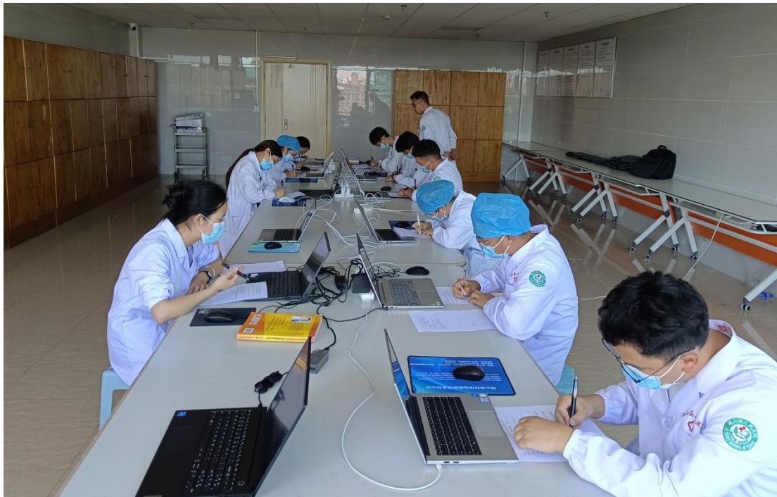
病史采集与病例分析