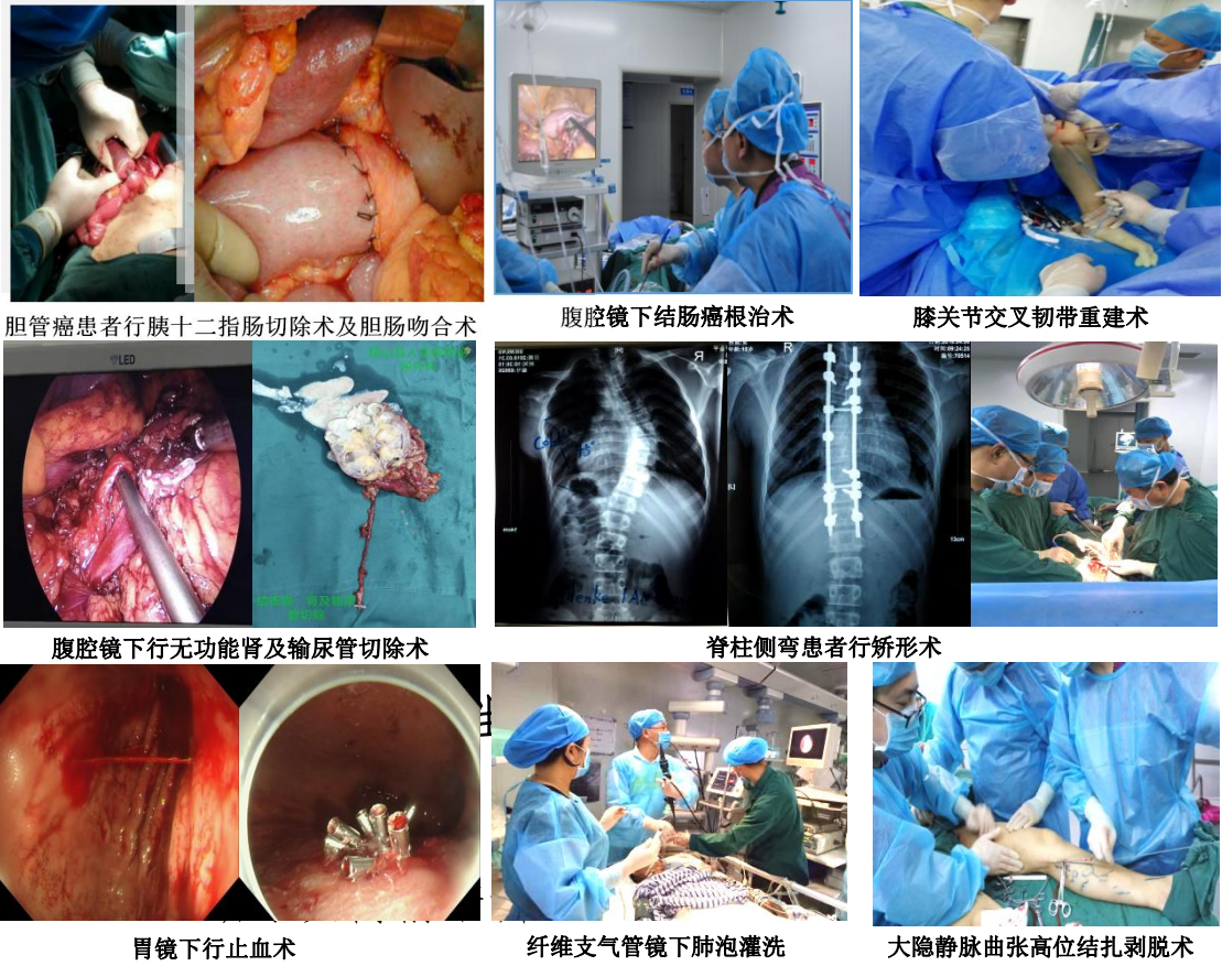
胆管癌患者行胰十二指肠切除术及胆肠吻合术