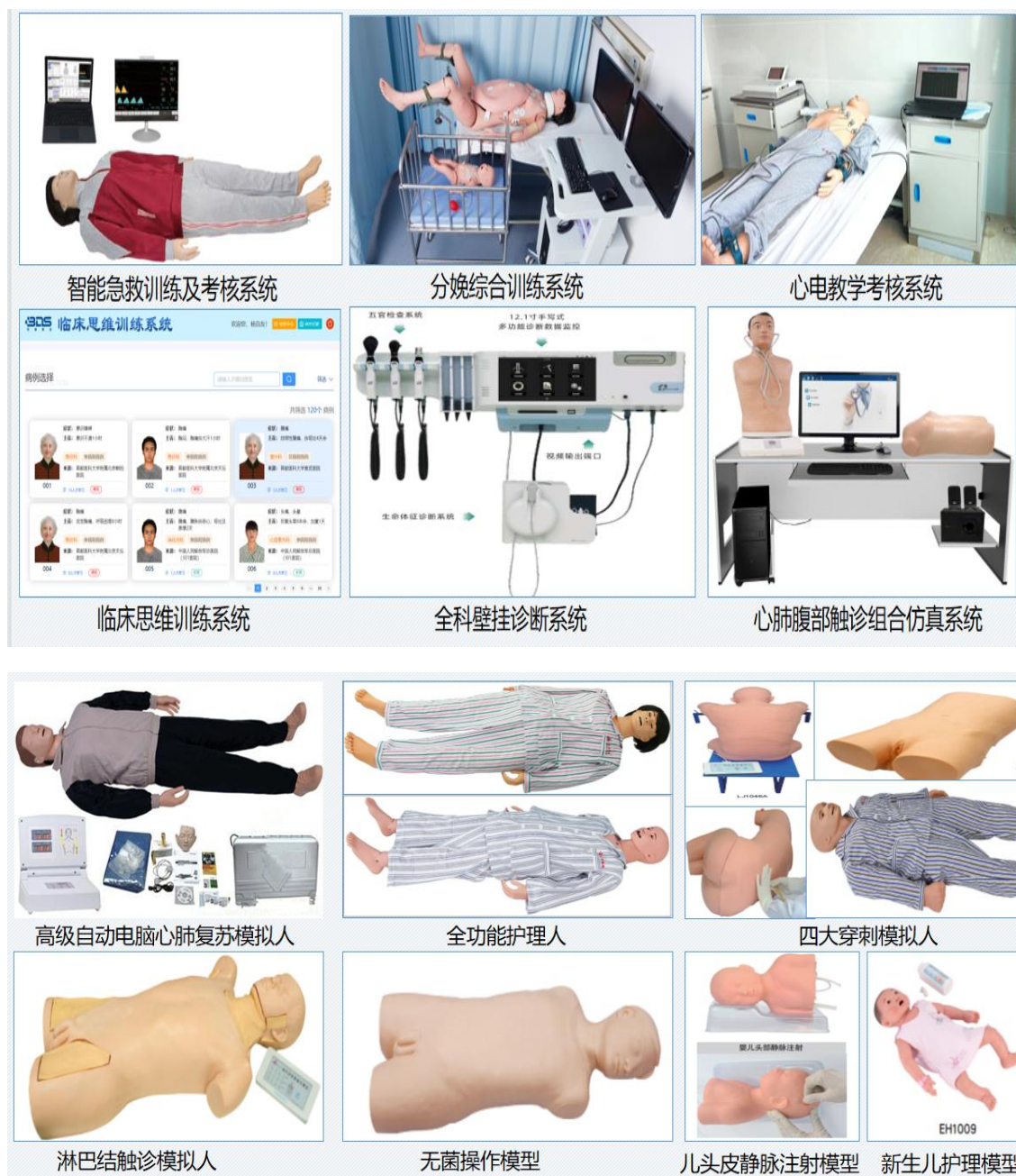
部分模拟教学模型

查模型、分娩机转模型等先进的教学培训、考核系统和模拟教学设备 150 余台套，为临床模拟教学、技能考核等提供了先进的技术条件和环境。