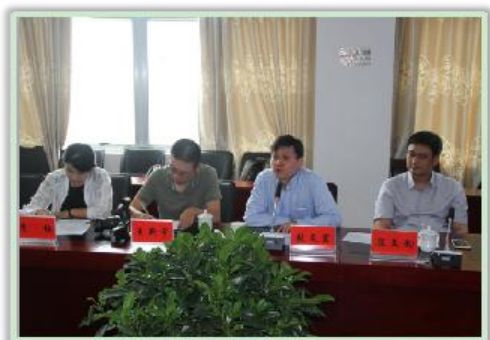
复旦大学附属华山医院

有 8 个省级临床重点专科，5 个保山市市级重点专科，有省内外专家工作站 28 个，是昆明医科大学第一附属医院、昆明医科大学第二附属医院、云南省第一人民医院联盟合作医院。