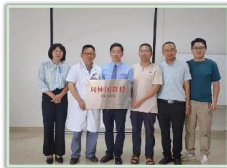
中山大学肿瘤防治中心