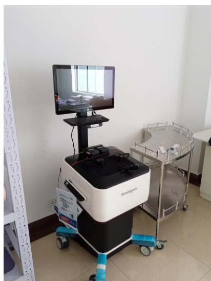
腹腔镜手术模拟训练系统

个基层实践基地。基地图书馆图书种类齐全、免费提供住院医师使用文献检索系统；专业基地及科室均有示教室；住培管理使用网络信息管理平台。师资力量雄厚，职称梯队结构合理，有专用教学区1500多平方米，成立有临床技能培训中心，占地面积1000余平方米，拥有上消化道内窥镜、电子大肠镜、腹腔镜手术等模拟训练系统等模型模具和设备，可满足各专业学员的临床技能培训。基地制定有全年临床技能培训计划，安排有专人管理技能中心并组织开展技能培训和考核工作。